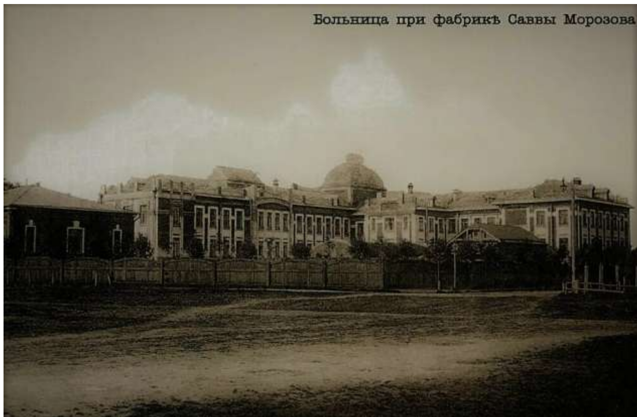
Больница при фабрике Саввы Морозова

Морозовы стремились устроить у себя качественное и полноценное медицинское обслуживание фабричного населения. Их смело можно причислить к российским лидерам в деле организации такой жизненно важной социальной сферы, как бесплатная врачебная помощь.