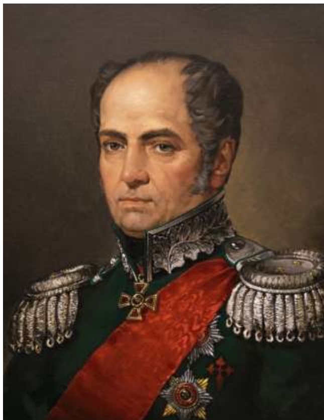
Августин Бетанкур (1758-1824).

В начале 1818 года заканчивалось строительство «Экспедиции заготовления государственных бумаг», основанной Августином Августиновичем Бетанкуром. К осени уже была отпечатана партия двадцатипятирублёвок.