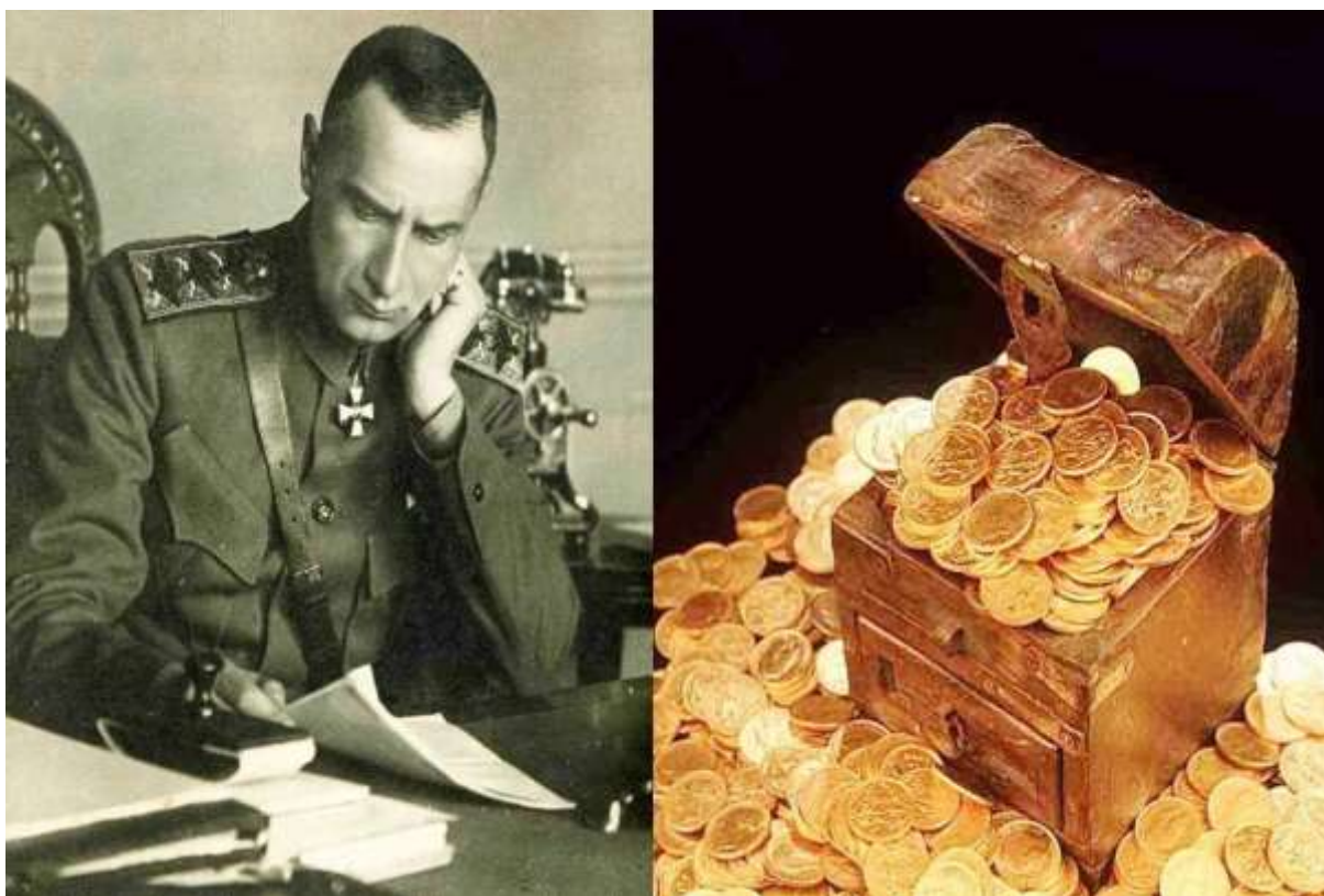
Александр Васильевич Колчак (1874–1920) - русский государственный, политический и военный деятель, учёный-океанограф, полярный исследователь, флотоводец.

Более двухсот миллионов царских рублей (сотни миллиардов, если перевести на современные деньги) - исчезли после гибели адмирала Колчака. Десятилетиями их искали на дне Байкала, в Чехии, Петрограде. Новые следы ведут в Китай и Монголию.