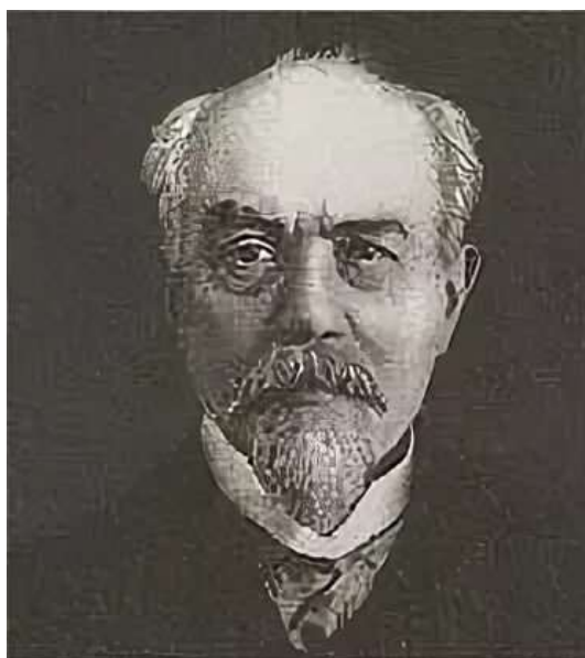
Иван Иванович Иванюков.

Иван Иванович Иванюков - российский экономист, публицист, дворянин родился в октябре 1844 года в Волынской губернии. Он окончил курс в кадетском корпусе, был кавалерийским офицером, но скоро оставил службу и поступил вольнослушателем на естественный факультет Петербургского университета, посещая также лекции филологического и юридического факультетов.