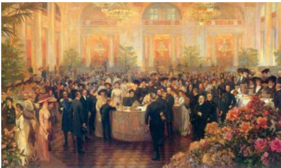
Дворянское собрание в Санкт-Петербурге.

Российская империя в начале XX столетия оставалась одной из немногих европейских стран, где не было подоходного налога. Это происходило во многом из-за нежелания лишить дворянство привилегий и усилить положение торгово-промышленных слоёв общества. При этом в периоды острого дефицита казны правительство рассматривало возможность перехода к подоходному обложению и даже разрабатывало различные законопроекты. Были проанализированы исторические условия создания законопроектов; учтены мнения о новации, которые высказывались во властных структурах специалистами и общественностью; просчитана экономическая эффективность нововведений. В результате закон о подоходном налоге в России был принят в 1916 году.