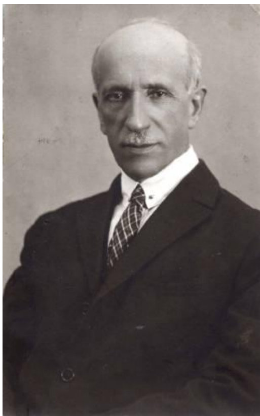
Рахмиль Яковлевич Вейцман (1870—1936)

Из статьи Р.Я. Вейцмана «О практических работах по счетоводству» // Коммерческая школа и жизнь, 1914-15, № 3 (вып. 10).