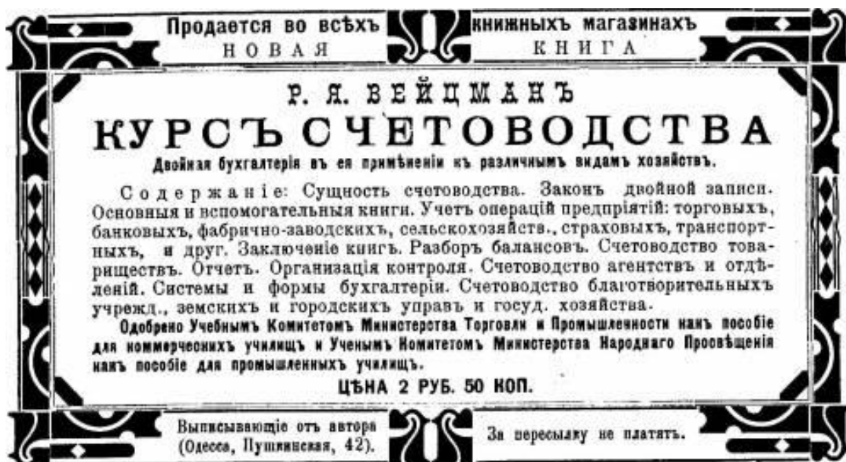
Обложка и реклама книги Р.Я. Вейцмана «Курс счетоводства»