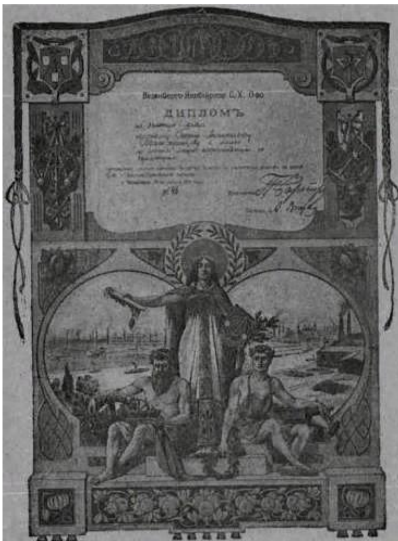
Дипломы, выданные бухгалтерским курсам Г.А. Бахчисарайцева